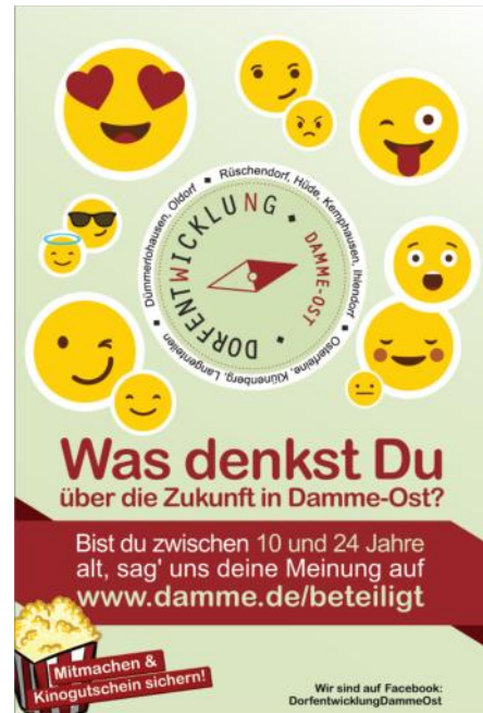
Abbildung 1: Plakatentwurf Kinder- und Jugendbeteiligung

Kinder- und Jugendlichen – Einbringen der Ergebnisse in den Planungsprozess